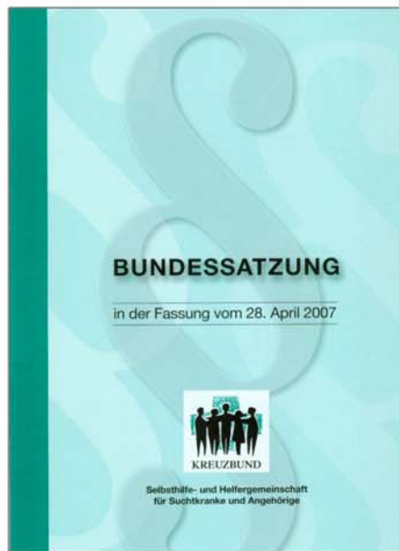
Bundessatzung (Bild: in der Fassung vom 28.04.2007)