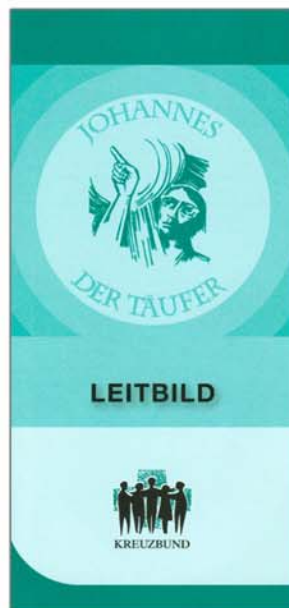
Leitbild (in der Neufassung vom 19.04.2008)