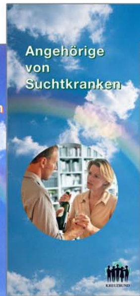
Faltblatt „Angehörige von Suchtkranken“