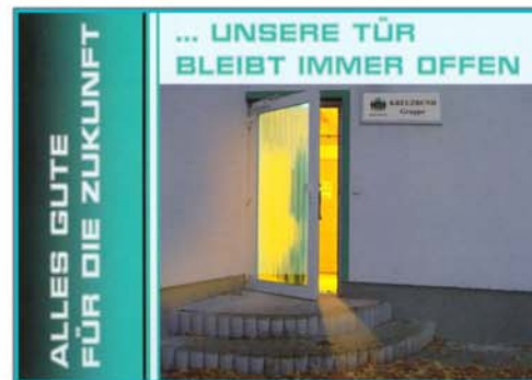
Verabschiedungspostkarte „Offene Tür“