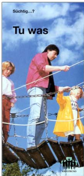
Faltblatt „Süchtig? Tu was“