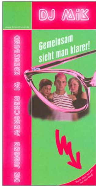
Faltblatt „Gemeinsam sieht man klarer“ - Die jungen Menschen im Kreuzbund (DJ MiK)“