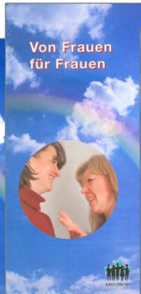
Faltblatt „Von Frauen für Frauen“