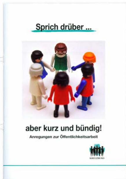
Leitfaden: "Sprich drüber... aber kurz und bündig". Anregungen zur Öffentlichkeitsarbeit.