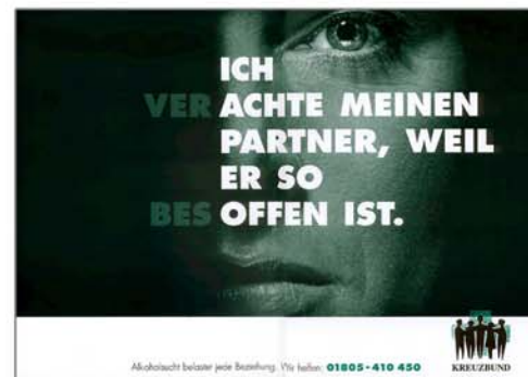
„Lebenslüge“ (Als Poster oder Postkarte)