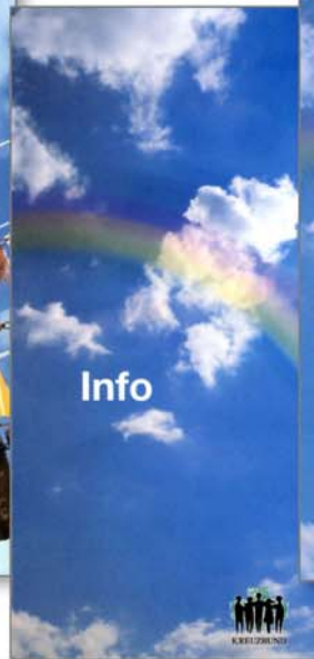
Faltblatt „Kreuzbund Info“