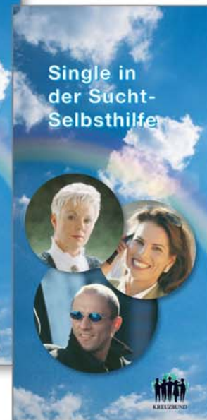
Faltblatt „Single in der Suchtselbsthilfe“