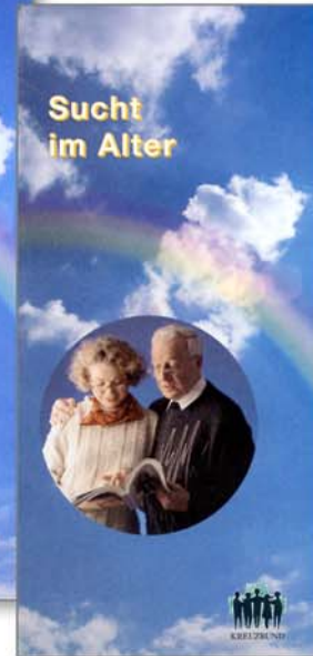
Faltblatt „Sucht im Alter“