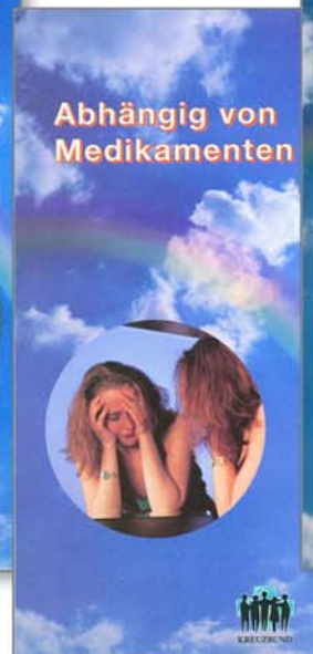
Faltblatt „Abhängig von Medikamenten“